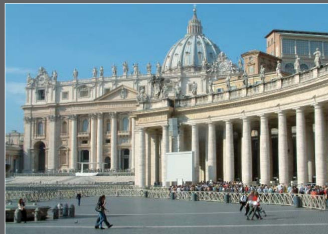
Piazza San Pietro, Roma