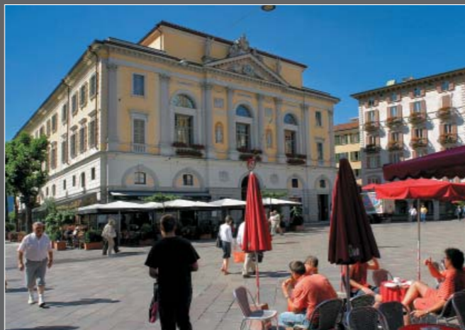
Piazza della Riforma, Lugano