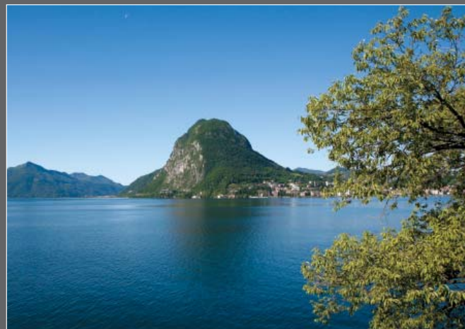
Mt. San Salvatore, Lugano