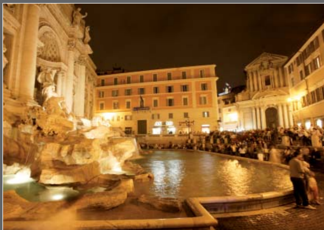
Fontana di Trevi, Roma